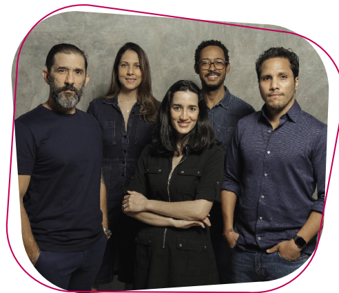
Equipo de Capital DBG

La agencia ha trabajado para algunas de las marcas más relevante del país, en esta ocasión nos presentan su top 5: