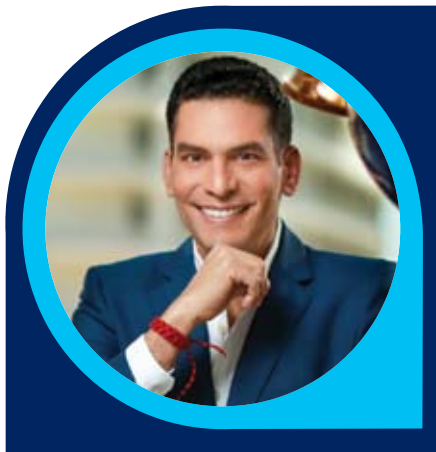
ISMAEL CALA Periodista y Presentador de Televisión de la Cadena CNNE

Cuenta la Biblia que cuando todos los hombres hablaban una misma lengua sobre la tierra, decidieron edificar una torre cuya cúspide llegara hasta el cielo. Aprendieron a quemar el barro y sustituyeron las piedras por ladrillos. Para pegarlos, utilizaron breca en lugar de argamasa. Dios (Jehová, Yahveh) bajó preocupado, y comprendió que nada impediría a aquellos hombres llevar adelante sus propósitos de llegar al cielo.