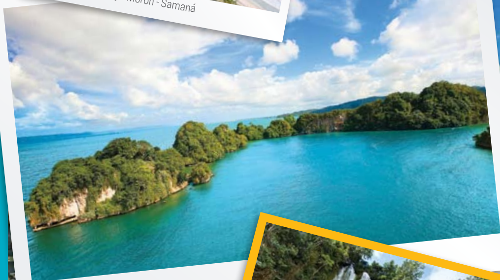
Los Haitises - Samaná