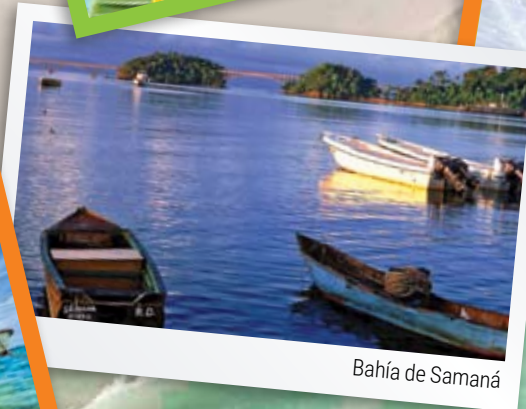
Bahía de Samaná