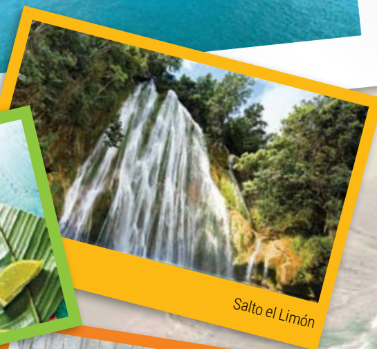
Salto el Limón