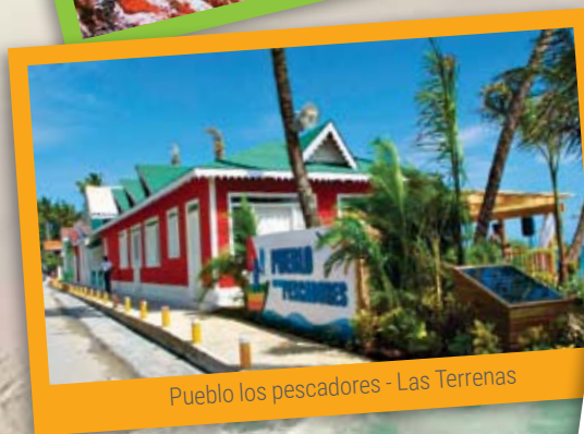
Pueblo los pescadores - Las Terrenas