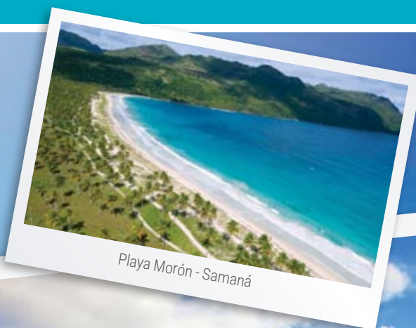
Playa Morón - Samaná

Las fuentes de pescados y mariscos y el ron se dejan sentir al ritmo del merengue, brindando al visitante excelentes opciones para el paladar.